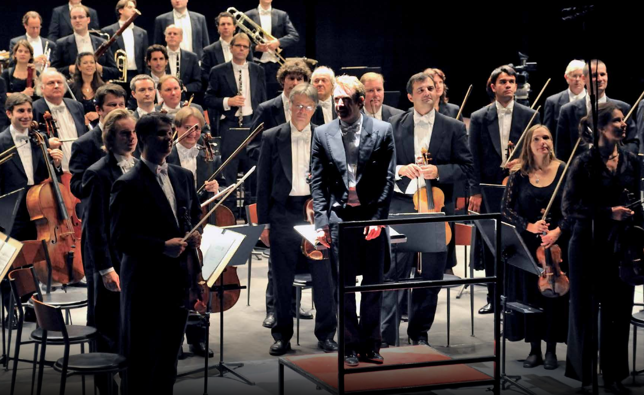
Kraljevski Concertgebouw orkestar i mo. Daniel Harding na svojem prvom zagrebačkom gostovanju u sklopu ciklusa Lisinski subotom , 6. listopada 2009. u Maloj dvorani Doma sportova